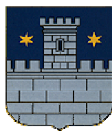
Grad Čakovec Međimurska županija