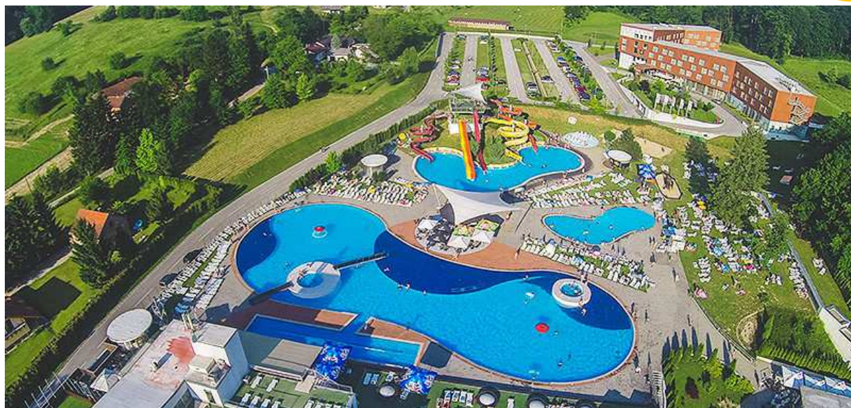
Terme Sveti Martin, glavni sponzor za praktične nagrade trkačima